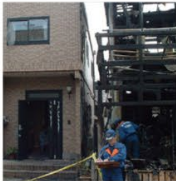
隣家火災 写真左:レスコハウス

PCパネルは燃えない建材。外部からの火災はもちろん、内側からの火にも強く、火災時のリスクを軽減できる数少ない建材です。