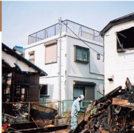
写真中央:レスコハウス