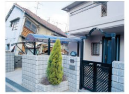
写真右:レスコハウス

現場打ちコンクリートより「軽い」「堅い」「強い」PCパネルは剛性が高く、地震による変形を抑えます。阪神・淡路大震災では、窓ガラス1枚の破損もありませんでした。